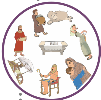
Hittan 2. évfolyam