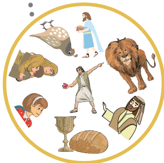
Hittan 3. évfolyam