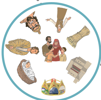
Hittan 4. évfolyam