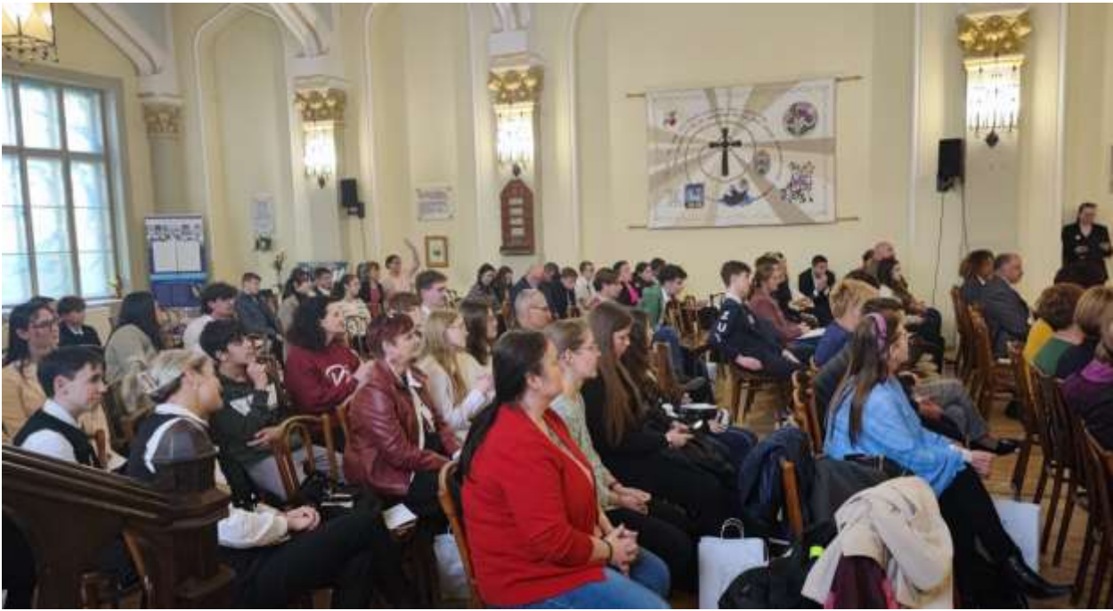
A verseny református kategóriájának résztvevői