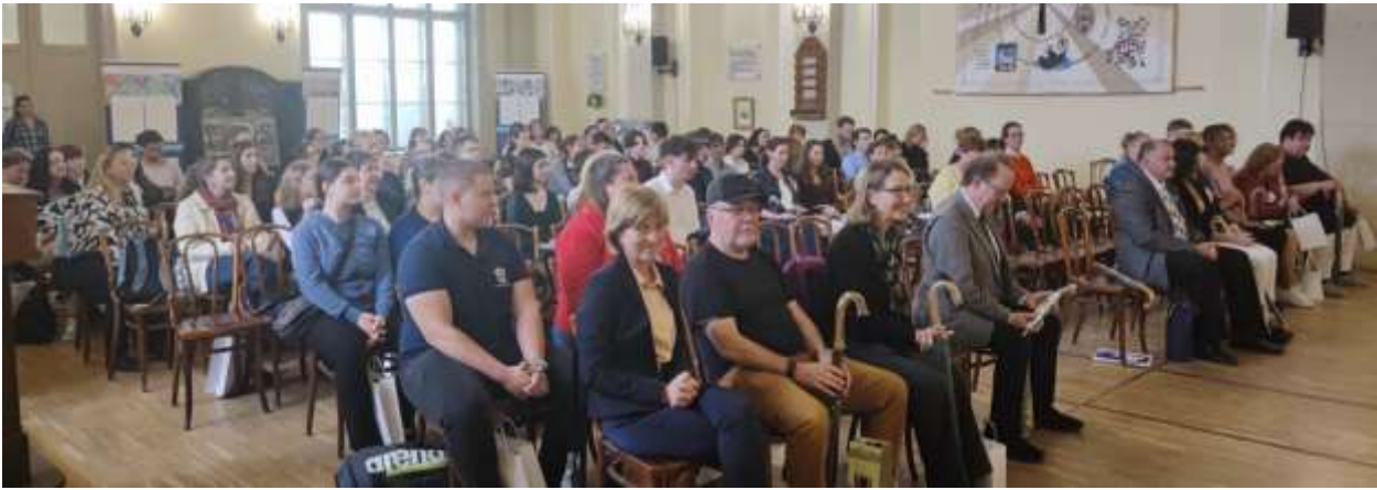
A verseny budapesti kategóriájának résztvevői