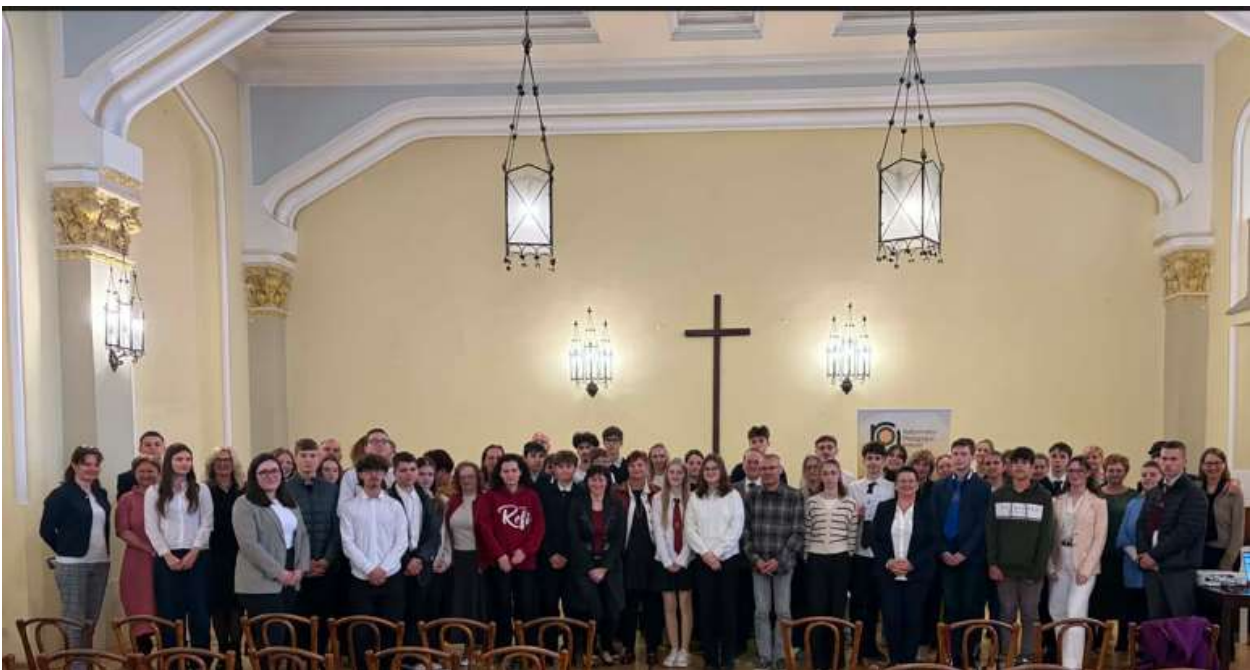
A verseny református kategóriájának résztvevői