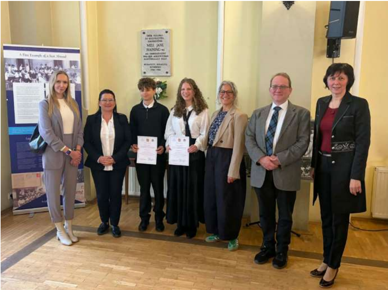
A Református iskolák 8. és 10. évfolyamos versenyének győztesei, a fő- és további díjak felajánlóinak képviselői, a Református Skót Misszió lelkesze, az RPI igazgatója és munkatársa