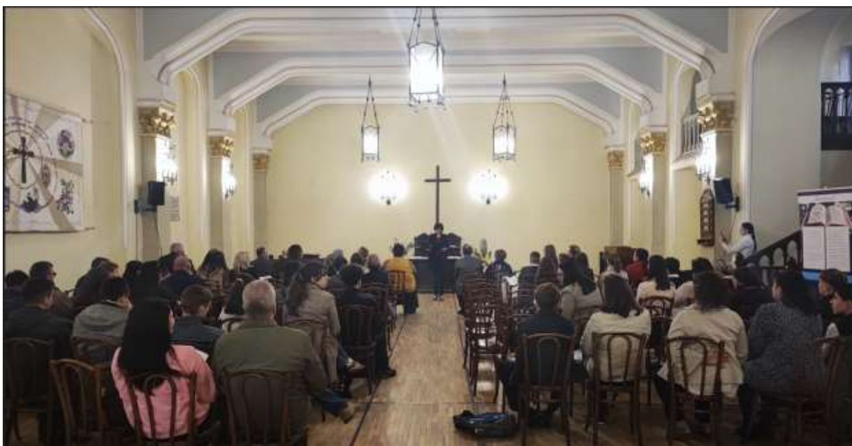
A verseny megnyitója