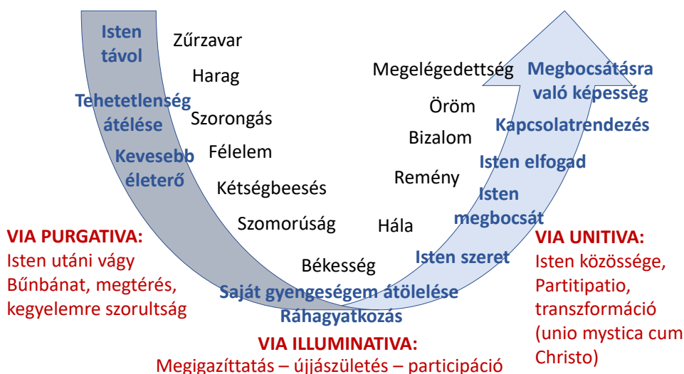
1. ábra: A hármass út

Az alábbiakban a lelkivezetői hagyományban sokat használt hatodik századi patrisztikus író, Dionüsziosz Aeropagitész hármass felosztását 15 hívjuk segítségül, hogy közelebb kerüljünk annak a megértéséhez, hogy a lelki út valójában nem egy lineárisan felfele haladó ösvény, sokkal inkább egy naponkénti megtéréssel járó, az óember és az újember közt oszcilláló, állandó mozgás Isten kegyelme és a mi emberi istenfelejtésünk közt.