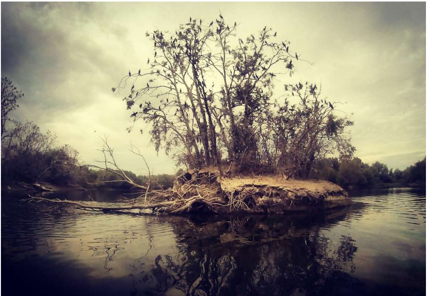
Folyóparti fa – Papp Dorka, 7.a